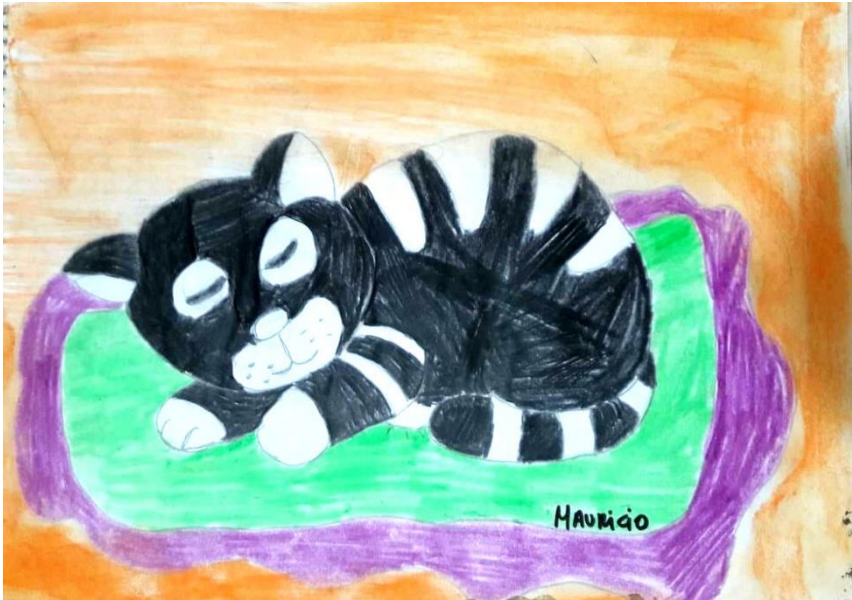
(Mauricio, Café de la Mary)

Extraño el latir de mi corazón apresurado bajando las escaleras y abrir la puerta, esa puerta roja; para recibirte.