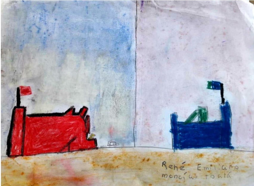
(René Emilino Mencías Tóala, Café de la Mary)