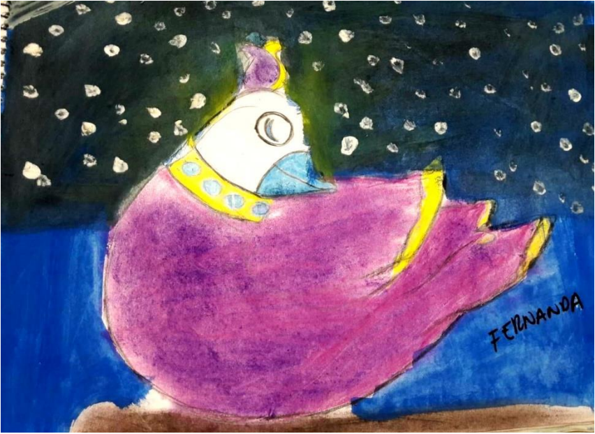
(Fernanda Falconi Figueroa, Café de la Mary)